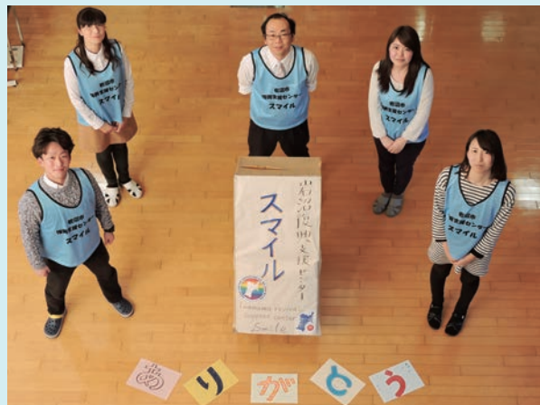
スタッフ一同より感謝申し上げます

復興支援センターは閉所となりますが、社協が取り組む地域福祉活動を進める中で、復興支援を継続してまいりますので、今後ともよろしくお願い申し上げます。