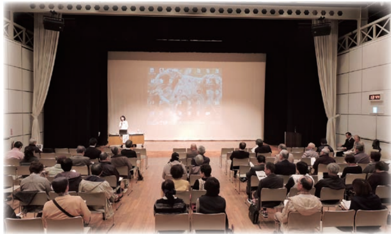
▲「自分のすむまちに活かしたい」とみなさん熱心に聴き入っていました。

内容 P2...平成二十八年度事業計画 他 P3...共同募金結果報告 他 P4...寄付者一覧 他